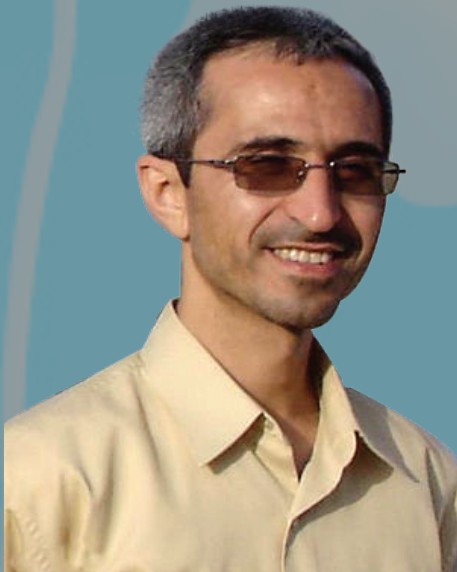
استاد شهید دکتر مجید شهر یاری