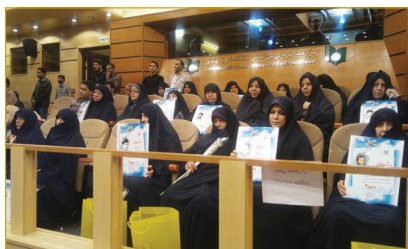
مراسم یادواره شهدای دانشگاه- آذر ماه ۱۳۹۲