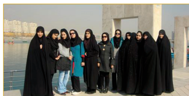
اردوی یکروزه پارک چیتگر ویژه اعضای فعال پشتیبان- اسفندماه ۱۳۹۲