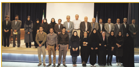
تقدیر از دانشجویان شاهد و ایثارگر برتر کنکور سراسری در اردوی معارفه سال ۱۳۹۲