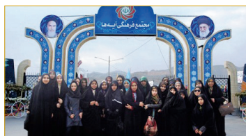
بازدید از مجتمع فرهنگی آیه ها- مشهد مقدس- بهمن ماه ۱۳۹۲